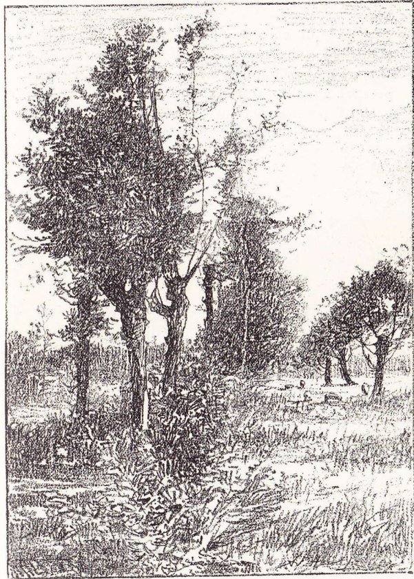
Coin de prairie à Petit-Bigard.

Notre chemin nous conduit directement à la distillerie de Petit-Bigard. En arrivant près de la drève d'entrée de l'établissement, prenons le chemin à main gauche. Très joli, ce chemin. Nous passons de petites mesures fort pittoresques, et plus loin, à droite, nous rencontrons les belles